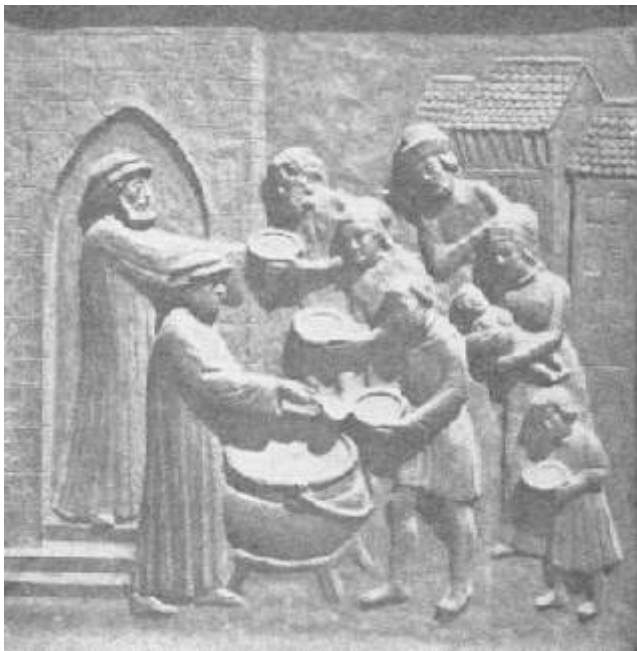
Eine erste diakonische Einrichtung der Reformation in Zürich: den Armen wird Suppe und Brot gereicht.

Im Mittelpunkt steht das Ideal einer reinen Gemeinde von Glaubenden, die außerhalb der Stadtmauern Zürichs auch verwirklicht wird. In der Abwehr ihrer Theologie hat Zwingli die von ihm ursprünglich ent-