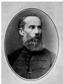
Ferencz, József (1835–1928) 23. Unitarischer Bischof in Kolozsvár (1876–1928) Verfasser des Unitarischen Katechismus 1864